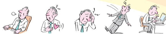
空腹感、力のぬけた感じ 発汗・動悸 頭が痛い 意識を失う 手足のふるえ