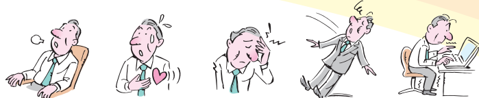
空腹感、力のぬけた感じ 発汗・動悸 頭が痛い 意識を失う 手足のふるえ