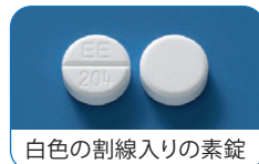
白色の割線入りの素錠

こちらのお薬は、患者様のお薬代の 負担が軽減されるジェネリック(後発) 医薬品です。