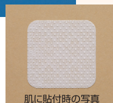
肌に貼付時の写真