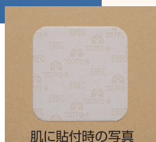
肌に貼付時の写真